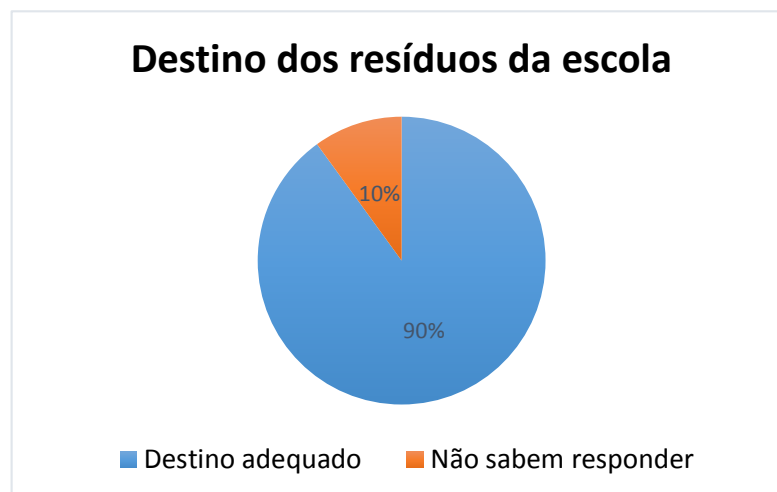
Gráfico 4- Porcentagem de alunos sobre o destino dos resíduos recicláveis da escola

Cerca de 90%, afirmam que os resíduos recicláveis da escola, bem como os resíduos orgânicos são encaminhados para o destino adequado.