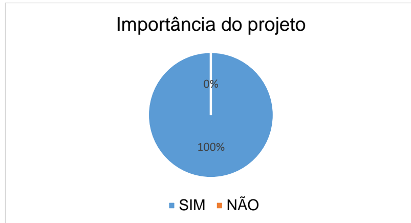
Gráfico 1- Porcentagem de alunos que consideram o projeto importante

Com a pesquisa pode ser constatado que todos os alunos consideram este trabalho desenvolvido importante para a proteção do meio ambiente, para a escola e para comunidade contribuindo também, para ruas mais limpas.